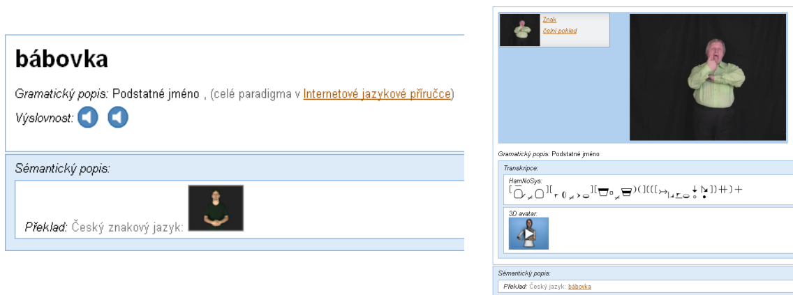
Obrázek 2: Vlevo: detail českého hesla, vpravo: detail odpovídajícího hesla v českém znakovém jazyce

tato hesla seřadit buď abecedně (v případě češtiny) nebo podle jedné z použitých notací (v případě českého znakového jazyka). Jednotlivá hesla lze také vyhledávat a to buď v případě mluvených jazyků textově (hledané slovo nemusí být v základním tvaru), nebo v případě znakového jazyka opět podle jedné z používaných notací. Položka Lekce pak slouží k vypsání hesel, která lze ze studijních důvodů rozdělit do lekcí např. podle vyučovaných předmětů. Na Obrázku 2 je vlevo ukázka detailu českého hesla (bábovka) a vpravo ukázka detailu odpovídajícího hesla českého znakového jazyka.